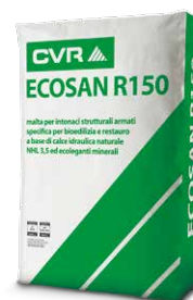
ECOSAN R150 base NHL 3.5 di classe M15 (EN 998-2)