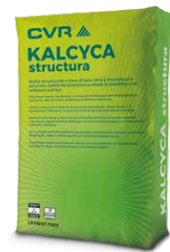
KALCYCA struttura base calce e pozzolana cement-free di classe M10 (EN 998-2)