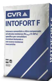
INTOFORT F base cemento di classe M15 (EN 998-2)