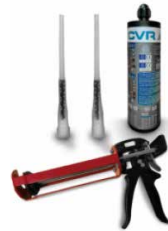
BCR 400 V PLUS