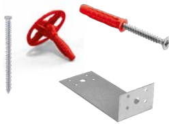
KIT SAFE PLUS

Viti autofilettanti da c.a. Flange in nylon Squadrette, Tasselli