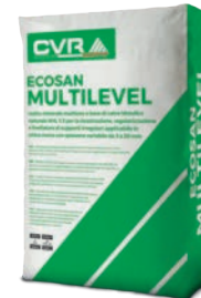
ECOSAN MULTILEVEL base NHL 3.5 di classe M15 (EN 998-2)