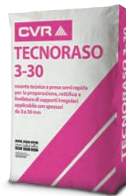
TECNORASO 3-30 base cemento di classe R2 (EN 1504-3)