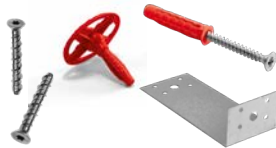
KIT SAFE PLUS Viti autofilettanti per metallo Flange in nylon Squadrette, Tasselli