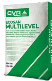
ECOSAN MULTILEVEL base NHL 3.5 di classe M15 (EN 998-2)