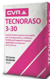
TECNORASO 3-30 base cemento di classe R2 (EN 1504-3)