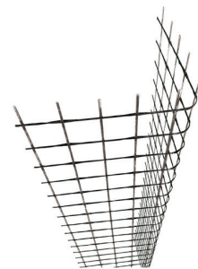
NETFIX CRM ANGULAR 490