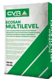
ECOSAN MULTILEVEL base NHL 3.5 di classe M15 (EN 998-2)