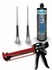
BCR 400 V PLUS