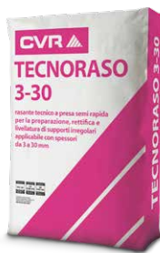
TECNORASO 3-30 base cemento di classe R2 (EN 1504-3)