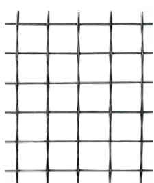
NETFIX CRM 490