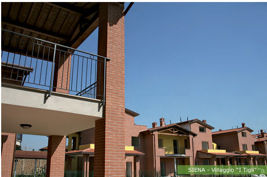
SIENA - Villaggio "I Tigli"