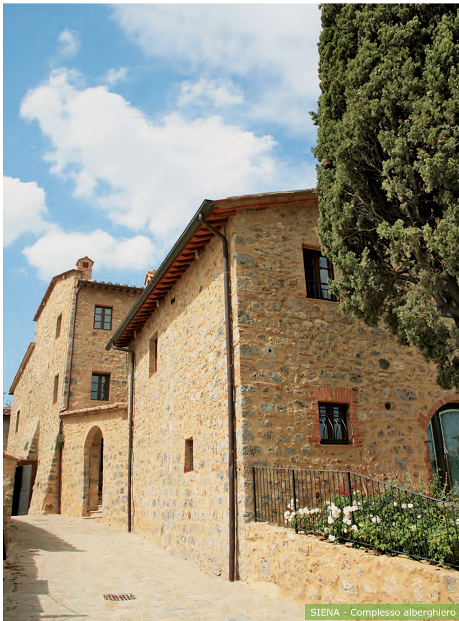
SIENA - Complesso alberghiero