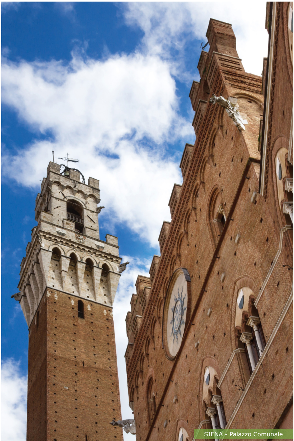
SIENA - Palazzo Comunale